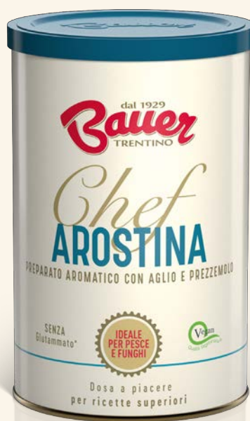
INSAPORITORE PER PESCE E FUNGHI con aglio e prezzemolo