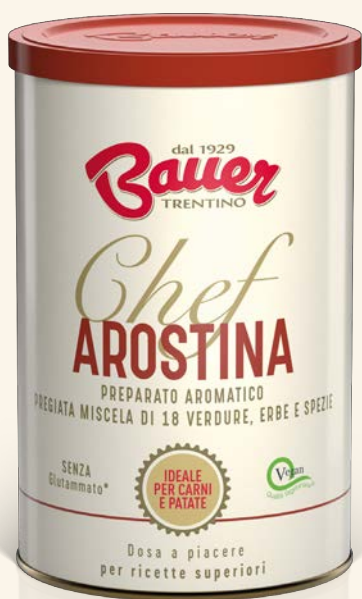
INSAPORITORE PER CARNI E PATATE con 18 verdure, erbe e spezie